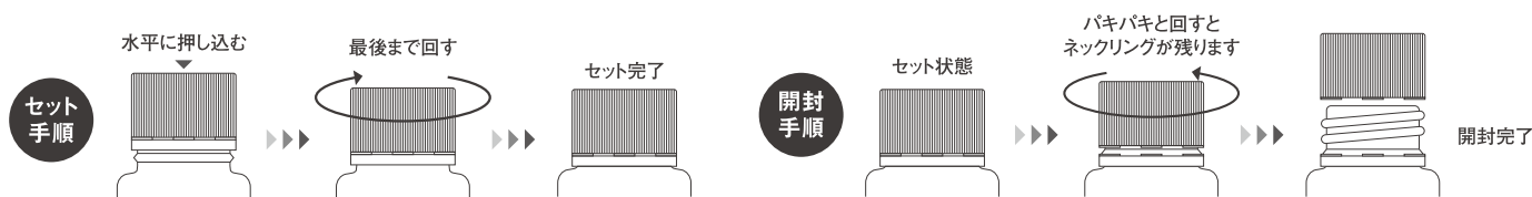
Virgin Cap Vials (Set) Spec バージンキャップバイアル<標準セット>

瓶本体にキャップを真っ直ぐ閉め込むだけでセットアップがカンタンに行えます。この状態でセキュリティが強化され、密閉性も保持されます。さらに開封はペットボトル飲料などと同じ要領で開けることが可能です。